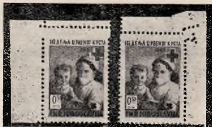
Slika 2 in 3

To bi bile najznačilnejše posebnosti, ki sem jih zasledil na znamkah Rdečega križa. V kolikor bodo ugotovljene še kakšne, jih objavim v drugi številki.