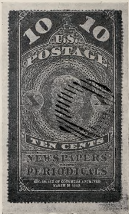
Največja znamka na svetu

Najmanjšo znamko je izdala nemška vojvodina Mecklenburg - Schwerin 1856. leta. Vrednost je \frac{1}{4} šilinga. Ker se je ravnala takratna poštna tarifa po razdalji, so uporabljali za frankiranje ustrezno število vrednot.