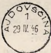
Žigi Ajdovščine a) avstr. b) pod Italijo c) LR Slovenija