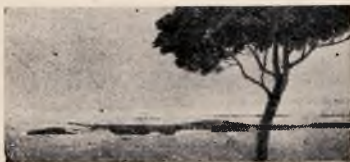
Brionski otoki blizu Pulja

Pred svetovno vojno je prodajal trgovce s papirjem nasproti takratne Kato-liške bukvarne poleg drugega tudi znamke. Drugod jih nisi dobil. Vse to je bilo takrat pri nas v povojih in filatelisti so bili redki. Tu sem v začetku iz skromnih sredstev kupoval majhne serije pisanih južnoameriških eksotičnih znamk, toda vse brez smotra; samo, da je bilo slikovito. Tistih, ki jih je bilo tačas dovolj — v mislih imam serije jubileja iz 1910. leta — si nisem oskrbel. Prav te so danes redke in jih marsikdo pogreša v zbirki.