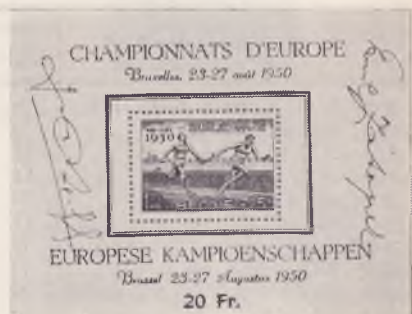
Belgija 23.—27. 8. 1950 Blok za evropsko lahkoatletsko prvenstvo. Desno na bloku je podpisan znani svetovni prvak Emil Zatopek.