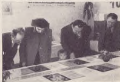
Z razstave v Metliki