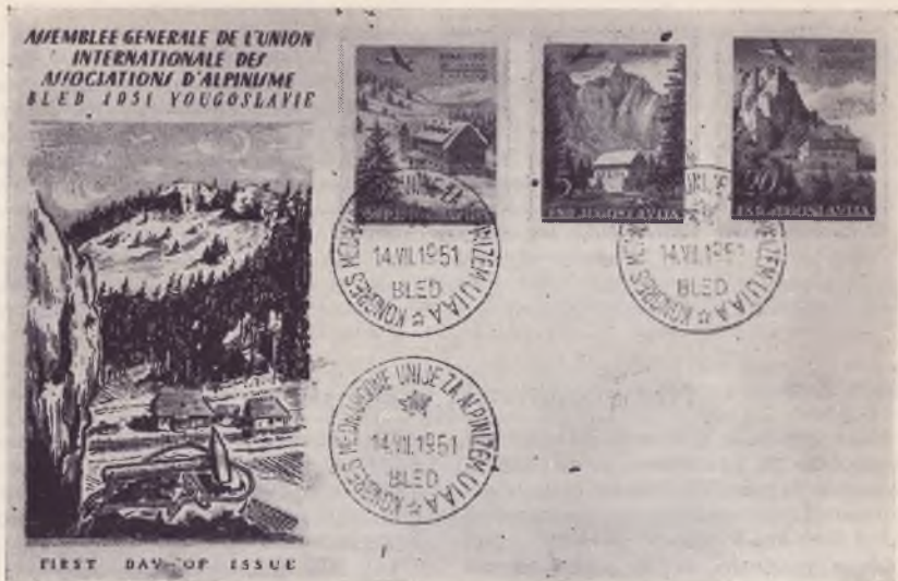
Naš spominski pisemski ovitek prvega dne (FDC (št. 7) ob kongresu mednarodne unije za alpinizem na Bledu

zapisano z malimi črkami Del. B. Jakac in na desni Sc. A. Cerne . Prva beseda Del. je okrajšava latinske besede delineavit , kar pove po naše je zrisal (Božidar Jakac). Druga označba Sc. pa je latinska okrajšava za izraz sculptis , kar bi prevedli po naše: je vrezal (A. Cerne).