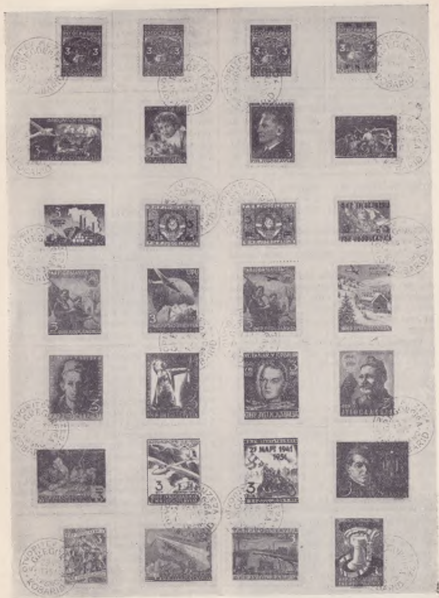
Edinstvena filatel. frankatura: 28 razliĉnih znakm po 3 din na pismu od 23.7. 1951