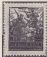
nov naziv + druga nominala