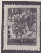
nov naziv države

Med evropskimi državami najdemo prvi pretiske v Italiji 1865 (Zumstein 25), ko je bila vrednota za 15 centov (modra iz 1863. leta) pretiskana z novo nominalo 20 centov.