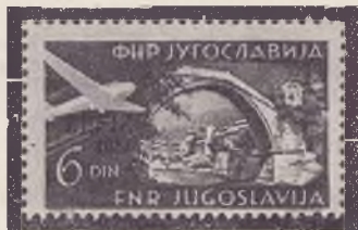
Natis: ZEFIZ 1951 (dogodek)

mer ni na podobi znamke ali na besedilu nič razvehljavljenegega.