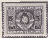
sprememba vrste znamke

Navadno so potrošne ali začasne znamke, ki s pretiskom spremene nominalo ali pa samo valuto (primer bivša NDH, tretji franko provizoriji 1941, pa FLR Jugoslavija 1946, partizani s pretiskom). Pretiske s spremembo valute imamo pri izdajah Gdanska (Guldeni na Marke), Liechtensteina (Rappeni na Heller) in podobno.