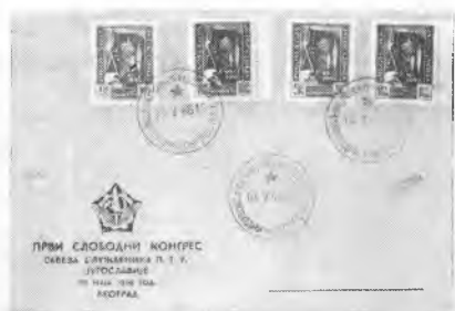
Ovitke št. 2. (Kongres PTT)