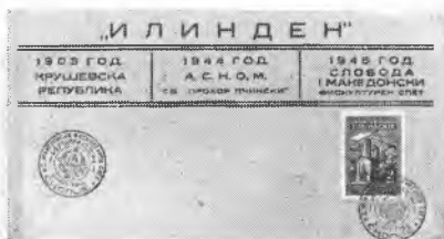
Ovitke št. 1 (Ilinden)