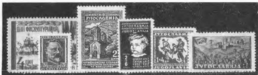
Razne velikosti prvih znamk FLR Jugoslavije

Težavna je bila doslej samo ureditev znamk Rdečega križa iz leta 1945. Serija sestoji iz dveh komadov različne oblike in velikosti, ki jih v albumu nikakor ne moremo razvrstiti tako, da