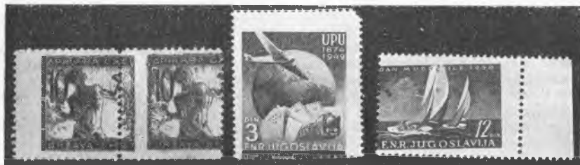
Pomanjkljivosti tiska in zobčanja: za zbiralce posebnosti.

Če se bomo ravnali vsaj po naštetih osnovnih načelih in dosledno pazili na kakovost znamke, ne da bi pri tem bili »pikolovci«, smo stopili dober korak naprej. Zbirke bodo vse bolj sposobne in zrele za razstave, sami pa bomo imeli več veselja in neposredno korist z boljšo kakovostjo.