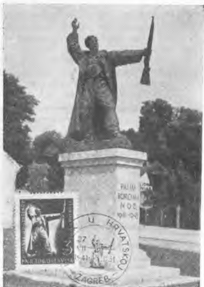
10 let hrvaške vstaje