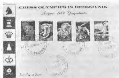
Ovitek (FDC) št. 4 (Sah. olimp.)

Dne 22. decembra 1951 prideta v promet ob proslavi 10. obletnice JA znamki za din 15.— frankovna in za din 150.— letalska.