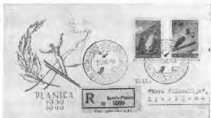
Ovitek (FDC) št. 3 (Planica)