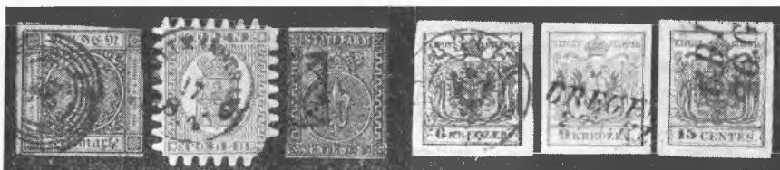
S l a b a kakovost klasičnih znamk — d o b r i kosi stare Avstrije

Moj namen pa je opozoriti na kakovost žigosanih znamk, ki so dandanašnji v prometu pri nas in v svetu. To so več ali manj navadnejše znamke, ki jih dobivamo od frankature. Po navadi operemo vse znamke s pisem (z izjemo znamk na ovitkih prvega dne in lepих frankatur s priložnostnimi žigi) in jih po sušenju »sortiramo« — uredimo. In prav tu je jedro našega filatelističnega znanja in dela. Povsem napačno je namreč, če »spravljamo« vse oprane znamke, ne da bi jih prej natančno pregledali in opredelili v kakovostnem merilu. Zaradi take povrhnosti naletimo pri menjavi na poškodovane znamke, bomo nujno oškodovani in se jezimo. Še so zbiralci, ki namenoma ne izločajo poškodovanih znamk, da bi se tako okoristili pri menjavi. V teh primerih bodo oškodovani zlasti novejši zbiralci, ki še ne poznajo filatelistične vede in zbirajo menda večkrat tudi zato, ker pač drugi zbirajo. Niso si še na jasnem, kaj in kako naj bi zbirali. Te zbiralce mora voditi predvsem veselje