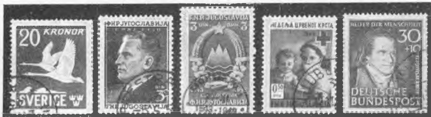
Primerki lepo žigosanih znamk. Take zbirajmo!

do filatelije in želja po pouku in razpoznavanju, kazati pa morajo tudi smisel za estetiko. S temi načeli bodo uspevali in čas jim bo odmeril področje zbiranja. Važno pa je, da bodo zbirali le nepoškodovane in dobro ohranjene znamke, bodisi nežigosane ali žigosane. Skratka: pri vsem svojem udejstvovanju vselej pazimo na najboljšo kakovost!