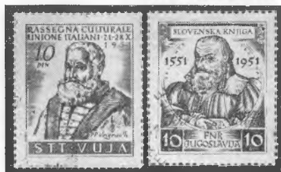
Vrednosti spominskih znamk Vergerij Trubar

P. P. Vergerij, po rodu iz italijanske koprške družine, je bil sprva pravnik. Po smrti žene se je odločil, okrog trideset let star, za duhovniški poklic. Prave duhovniške izobrazbe ni imel, z zvezami pa je dosegel, da so mu zaupali višje cerkvene funkcije. Kmalu se je