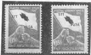
7. X. 1951: Rdeči križ