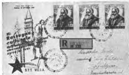
STT-VUJA — 21. 10. 1951 Ovitek prvega dne (FDC) št. 1

3. januarja 1952 letalsko znamko za 20 šilingov.