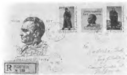
STO-VUJA: FDC ovitek šte. 5

Filatelisti sicer lahko z veseljem ugotovimo, da število izdaj od leta 1948 stalno pada, in sicer od skoraj 3.000 v navedenem letu do zgoraj navedene številke v letošnjem letu, torej nekaj manj kakor za tretjino. To je razveseljiv pojav, ki kaže, da se tudi v emisijskih krogih pojavljajo trezne tendence; samo pravilna emisijska politika bo lahko pomagala rešiti filatelijo.