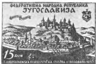
Posebna beograjska razstavna znamka

razstav širom Slovenije dovolj močni, da se pomerimo v plemeniti borbi z ostalimi bratskimi zvezami. Od slovenskih filatelistov je odvisno, ali bo zmogla prikazati naša Zveza v Beogradu pravo stanje slovenske filatelije in njeno mesto v Jugoslaviji. Osvetliti moramo tako našo tradicijo v filateliji, ki resda ni bogata in obširna, a je vendarle, obenem pa moramo prikazati tudi napore poslednjih let, to je delo FZS na razširitvi filatelije v Sloveniji. Le tako bomo na razstavi v Beogradu doprinesli k utrditvi Saveza Filatelista Jugoslavije in dokazali svojo voljo za sodelovanje z vsemi jugoslovanskimi filatelisti. Ni potrebno posebej poudarjati, kolike važnosti je to za afirmacijo SFJ, ki je edini sposoben, da se v tesnem sodelovanju z vsemi republiškimi zvezami bori za zdrav razvoj filatelije pri nas. Beograjska razstava mora prikazati pot, ki jo je prehodila naša filatelija od osvoboditve do danes in pokazati perspektive nadaljnega razvoja. Prikazati mora mesto filatelije v naši socialistični stvarnosti. Filatelistične manifestacije v dneh pred VI. kongresom KPJ morajo biti tudi odraz vdanosti filatelistov Partiji in Titu v zavesti, da je tak razmah naše organizacije bil mogoč samo v socialistični Jugoslaviji.