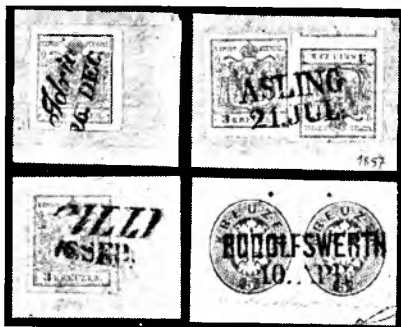
Podolžni žigi Idrija v ležeci, tako imenovani angleški pisavi. Jesenice na Gorenjskem v pokončni antikvi. Celje v ležeci pisavi in Novo mesto v pokončni groteskni pisavi.

stotke. Zato pa je poštar moral skrbeti ne le za plačo morebitnega pomožnega osebja — po navadi mu je pri delu pomagala družina — temveč je moral kupovati tudi vse obratne potrebščine, med njimi tudi žige. Sicer pa se je seveda moral