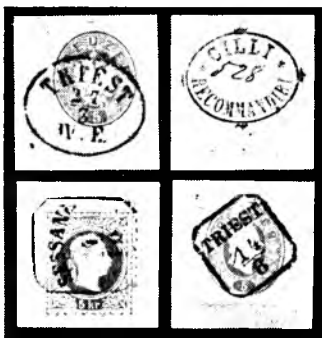
Žigi posebnih oblik: ovalni žig Trst z datumom in z navedbo odprave (IV. Expedition), ovalni žig Celje za priporočene pošiljke; spodaj osmeroovalna žiga Sežana in Trst. Vsi štirje žigi v antikvi.

domnevo, da so letnico vstavili vanj šele, ko je dunajsko ministrstvo za trgovino 22. julija 1867 odredilo uvvedbo letnice na poštnih žigih. Na slovenskem ozemlju je bil imel dotlej datum z letnico edinole Trst, in sicer že iz predfilatelistične dobe. Naredba je določala, da naj izpopolnijo zasebni poštni uradi svoje žige z letnico takoj, drugi (državni) uradi pa, brž ko bi bili potrebni novi žigi. Na novo ustanovljeni uradi so seveda takoj dobili nove žige z letnico. Tako se je zgodilo, da so mnogi državni poštni uradi dobili žige z letnico le sčasoma, nekateri šele mnogo let kasneje, znana staroavstrijska lagodnost pa je tudi povzročila, da se nekateri zasebni poštarji niso zmenili za naredbo in je bilo zato le nekaj starih žigov izpo-