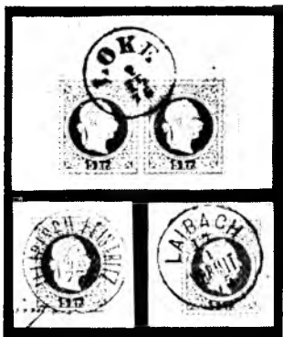
Enokrožni žigi z datumom in letnico Loke v antikvi, Ilirska Bistrica in Ljubljana v groteskni pisavi. Ljubljanski žig ima tudi označbo odprave (Vormit/tag, do-poldne).

Čudna razporeditev datuma na rogaškem pošarskem žigu vzbuja