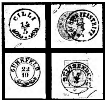
Enokrožna žiga brez letnice: Celje s stilizirano vejico in Bohinjska Bistrica; spodaj dvokrožna žiga Krško s stilizirano vejico in Zuzemberk z zvezdico. Vsi štiri žigi v antikvi.

Na Slovenskem je bilo razmeroma malo zasebnih poštarjev, vendar pa so tako imenovane poštarske žige vsaj v prvih letih te dobe imele pošte Celje, Ljutomer, Ormož,