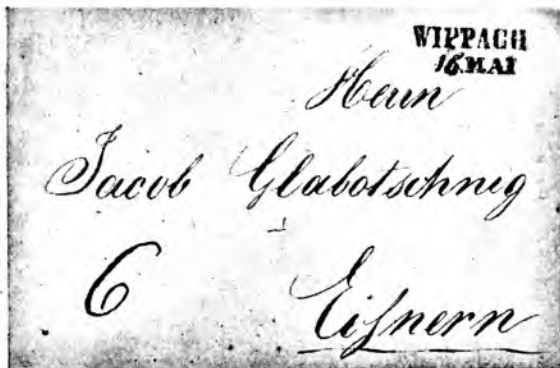
Predfilatelistično pismo iz Vipave z dne 16. maja 1845

štarjev. Medtem ko je prve plačevala poštna uprava in jim dajala vse, kar so potrebovali za nemoteno poslovanje svojega urada, torej tudi poštne žige, drugi niso imeli stalne plače. Dobivali so ali dohodke svoje pošte v celoti ali pa so poštni upravi plačevali najemnino; pri nekaterih poštah je poštna uprava sicer pobrala dohodke, vendar pa je od njih plačevala poštarju primerne od-