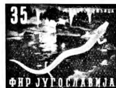
modrozeleno/lososovordeča (človeška ribica)