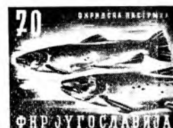
zelenomodra/olivnorjava (ohridska postrv)