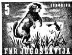
oranžna/žgana sicna (tekunica)