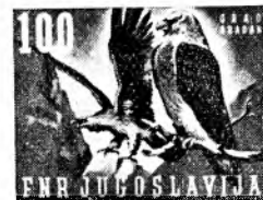
zelena/rjava (brkati šer)