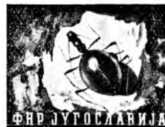
modra/rdeča (jamski mrhar)