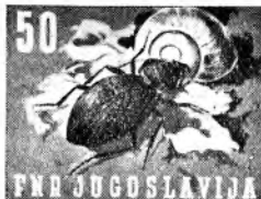
olivnozeleno/črna (orjaški krešič)