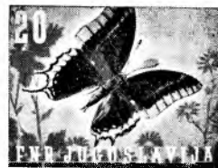
temnorumena/črnorjava (dvorogli pogrcbec)