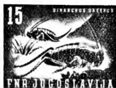
karmin/olivnozeleno (debelonogi oklepnik)