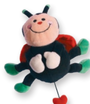
PIKAPOLONICA Z MELODIJO