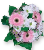
ŠOPEK SVEŽEGA SEZONKEGA CVETJA