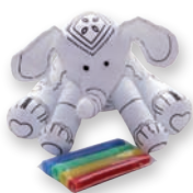
SLOŃČEK - POBARVAJ ME

Priljubljenosti si pravico do spomenske programa. Fotografije so simbolične.