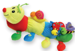
DIDAKTIČNA GOŠENICA Z ROPOTULJICO