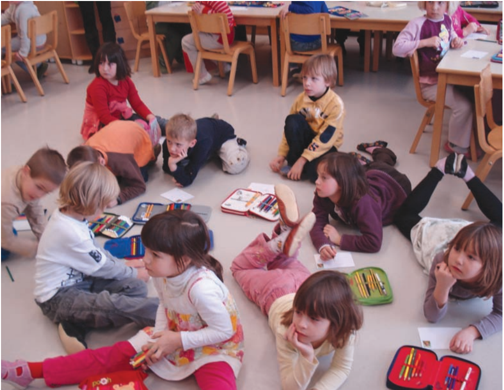
Otroci z Loga vneto rišejo.

Člani FZS smo lani na Otroškem bazarju, ki je potekal od 11. do 14. 9. 2008, v imenu Collecte na posebnem paviljonu dežurali štiri dni. Pošta Slovenije je za delo z mladimi podarila 500 znamk nominale A, večjo količino Biltenov št. 70 in 71, precej ovojnic prvega dne in brošuro Moj konjiček, zbiranje znamk.