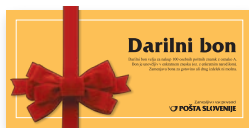
BON OSEBNE ZNAMKE