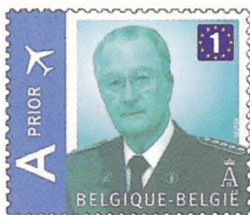
Code: KB09(1E)* Denomination: € 0.80**