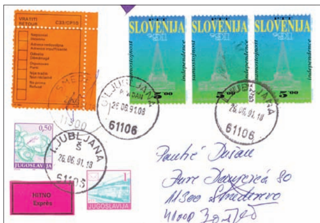
Prvi dan uporabe slovenske znamke Parlament na pismu, poslanem v SR Srbijo, v Smederevo, vrnjenem kot nevročeno.

Problemi medrepubliških odnosov, ki so se nabrali v SFR Jugoslaviji ob koncu osemdesetih let XX. stoletja, so dosegli višek z odločitvama dveh jugoslovanskih republik, da začneta s procesom svojega osamosvajanja. To sta bili SR Hrvaška in SR Slovenija. Temu so izrazito nasprotovale socialistične republike z večinskimi srbskim in črnogorskim prebivalstvom (SR Srbija in SR Črna Gora) in so pomembno vplivale na odločitve Predsedstva SFRJ. Ker SR Hrvaška in SR Slovenija nista mogli sporazumno rešiti nastalih problemov z vsemi članicami SFRJ, sta obe 25. junija 1991 sprejeli odločitev o odcepitvi od ostalega dela Jugoslavije.