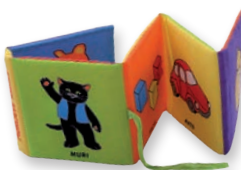
MEHKA KNJIGA MAČEK MURI