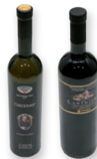
BELO IN RDEČE VINO*

*Minister za zdravje opozarja: Uživanje alkohola lahko škoduje zdravju.