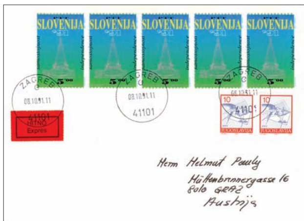
Uporaba slovenske znamke Parlament v poštnem prometu Republike Hrvaške na njen prvi dan suverenosti (hrvaške znamke še ne obstajajo).

Po končanem trimesečnem moratoriju, ki je bil določen z Brijunsko deklaracijo, je Sabor Republike Hrvaške 8. oktobra 1991 sprejel odločitev, s katero je uresničil odločitev ustavnega sklepa s 25. 6. 1991 in prekinil vse državno pravne odnose s SFRJ. S tem dejanjem, hkrati razrešena obvez Brijunske deklaracije zaradi preteka trimesečnega roka, je postala Republika Hrvaška neodvisna in samostojna, suverena država. To je veljalo tudi za Slovenijo, ki ji je samo Brijunska deklaracija preprečevala izvedbo odločitve slovenske Skupščine o