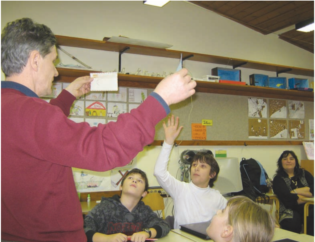
Otroci v Črnomlju z zanimanjem spremljajo razlago

podobno. Vsi, ki pri tem potrebujete nasvete in pomoč, se obrnite na naslov fsz.tajnik@email.si .