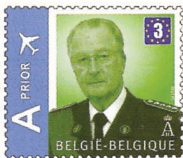
Code: KB09(3E)* Denomination: € 2.40**