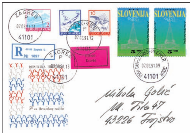
Prvi dan uporabe slovenske znamke Parlament v poštnem prometu SR Hrvaške (ura na žigu PRVI DAN je vedno nastavljena na 9. uro, toda pisma so predana na poštnem okencu pred 13. uro, ko so šla v odpravo).

Procesi razdruževanja Hrvaške in Slovenije z ostalim jugoslovanskimi republikami so bili medsebojno prepleteni z dogodki, katerih posledica je končno pripeljala do dveh novih suverernih držav. Iz priložene preglednice lahko ugotovimo časovno usklajenost teh dogodkov, kar seveda ni slučajnost. Tako pomemben politični korak, ki je nosil dalekosežne posledice na meddržavne odnose vsega sveta, je moral biti dobro pripravljen. Zaradi tega je jasno in vidno iz preglednice, da sta morali Hrvaška in Slovenija dajati v tem procesu razdvajanja ena drugi pomembno podporo pri doseganju v resnici istovetnih in skupnih prizadevanj.