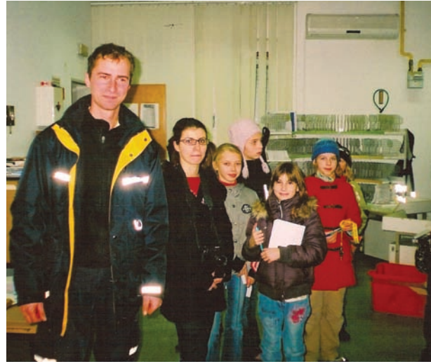
Z obiska na pošti

pismonoš in smo si z zanimanjem ogledali, kako pisma, dopisnice in pakete ročno ali strojno žigosajo. Potem smo si ogledali delovna mesta pismonoš z mnogo predalčki v katere si pismonoše zložijo pošiljke preden jih odnesejo naslovníkom. Vsaka ulica in vsaka hiša spada v določen predalček in pismonoše imajo tako razdeljeno, v kateri del Žalca kdo nosi pošto. Seveda smo vsi hoteli vedeti, kateri prostorček je za naše stanovanje oziroma našo hišo. Tako razvrščena pisma, dopisnice in pakete pismonoše potem zložijo v svoje velike torbe in z njimi že navsezgodaj odidejo na teren, ne glede n ato, kašno je vreme. Ogledali smo si še sprednji del pošte, kjer je vhod za stranke, se zahvalili g. Šibancu in odšli nazaj v šolo.