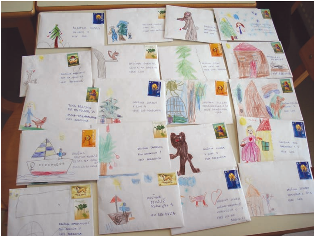
Na Logu je nastalo nekaj zanimivih priložnostnih ovojnic

je celo reklo, da so tam že bili. Seveda nisem mogel mimo primerka "odrezane" znamke z razglednice. Povedal sem jim, da tega pač ne smejo delati, sicer bom zelo hud. Narisali so nekaj več kot 10 risbic na ovojnice. Naslove smo jim pomagali napisati mi. Pojavilo se je še eno vprašanje: "Kako spraviti list A4 v manjšo ovojnico?". Tudi to smo rešili. Pozneje so mi učiteljice povedale, da so najbolj veseli bili doma, ko jih je čakalo pismo.