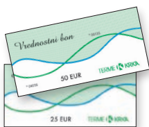
DARILNI BON TERME KRKA