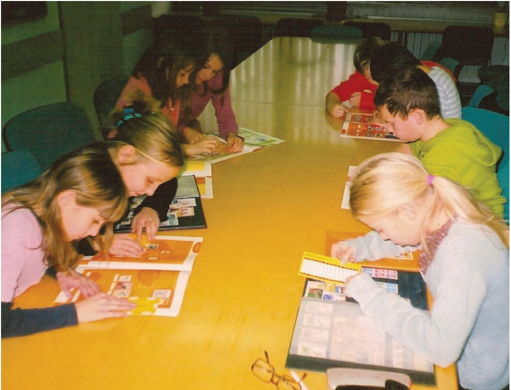
Krožkarji pri delu. Delovni zvezki so zakon