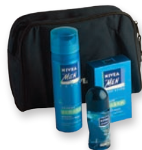
MOŠKI NEGOVALNI SET NIVEA

Priljubljenosti si pravico do spomenske programa. Fotografije so simbolične.