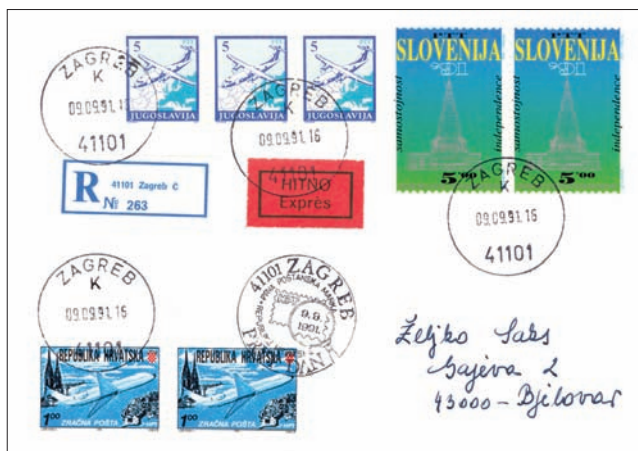
Prvi dan uporabe prve hrvaške poštne znamke Zračna pošta Zagreb–Dubrovnik, ki jo je izdala pošta R Hrvaške (mešana frankatura).

V zgodbi o uporabi Parlamenta v poštnem prometu hrvaške pošte je morebiti