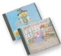
ZGOŠČENKA ŠMENTANA MUHA ALI NAJLEPŠE SLOVENSKE PRAVLJICE

Pošta Slovenije d.o.o., Stomškov trg 10, Maribor