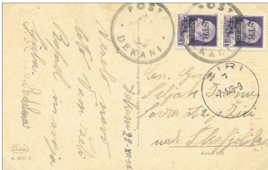
Razglednica poslana iz Dekanov, administrativni žig (štampljka) Dekani, v Žiri. Poština 2 liri (pretisk na znamkah ni bil upoštevan).

O znamkah smo že napisali, da so bile na razpolago sicer v malih količinah tudi na pošti Koper. Menimo lahko, da VUJA (tedaj že na Reki), ni spoštovala stare italijanske razdelitve na pokrajine, ampak je delovala povsem po svoje in za celotno območje cone B. Zato ne preseneča, da provizorije ISTRRA, drugi pretisk in RIJEKA-FIUME najdemo na raznih pošiljkah iz krajev v Slovenskem Primorju kot v Istri (glej Tabela 1). Pretisk RIJEKA-FIUME je moč najti tudi v mešanih frankaturah. Sam imam kar nekaj takih žigov, nekaj jih lahko vidimo tudi v Katalogu KOPERFILA 2001, str. 50.