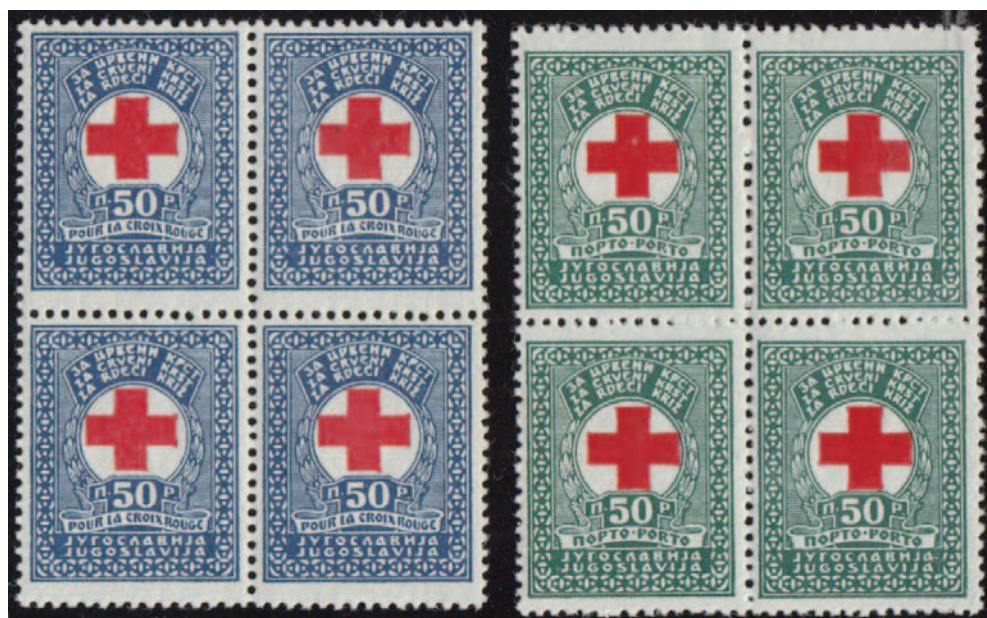
Prve doplačilne znamke za Rdeči križ.

več podatkov in navaja nekaj primerov, med drugimi tudi ta, mariborski. Poleg tega navedka in slike o omenjenem provizoriju nisem našel drugih informacij.