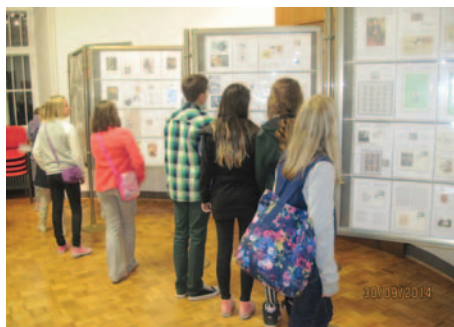
Vsebina razstave je pritegnila dosti mladih.