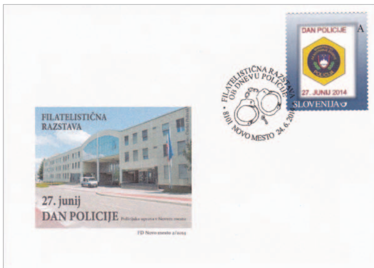
Spominski ovitek ob razstavi v prostorih Policijske uprave Novo mesto.

nezainteresirane), občasno obiščemo filatelistični krožek na OŠ Šmarjeta oz. njihovo mentorico in ji izročimo nekaj filatelističnega gradiva. Gradivo smo že večkrat poslali tudi krožkarjem v Žalec in enkrat v Prebold.