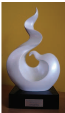
Velika nagrada razstave, ki so jo osvojili krožkarji iz Žalca

V okviru IX. filatelistične šole v Trakošćanu smo poleg krožkarjev iz Hajdine sodelovali tudi drugi. Dan prej so tam odprli mednarodno mladinsko filatelistično razstavo, na kateri so po-