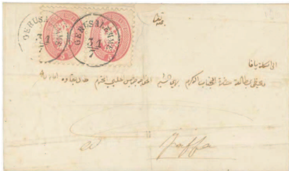
31. julij 1864 - pismo z znamkami za Lombardijo, poslano iz KuK poštnege urada s poštno kočijo v Jaffo. Okrogel žig 31/7 GERUSALEMME. Poštšina 10 Soldov (8 Soldov poštine do Jaffe in 2 za dostavo v Jaffi).

tih), ki je prevzela vlogo Lloyda pri dostavi in odpremi pošte. Tako Lloyd kot KuK Avstrijski poštni uradi so sloveli po