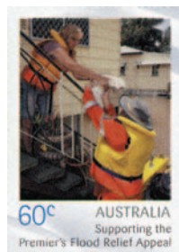
Prva avstralska znamka z doplačilom v zgodovini.

toda tudi na neposreden način pomagajo žrtvam poplav s pomočjo poštних znamk z doplačilom.