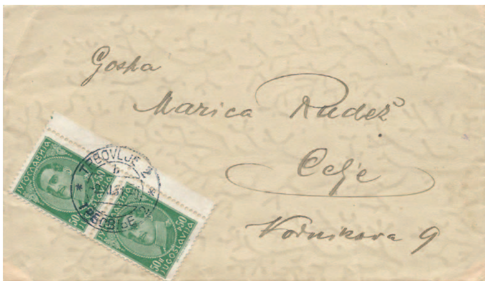
Pismo prve masne stopnje je po ceniku iz leta 1922 pravilo frankirano v vrednosti 1 dinarja.

Pričakovano bi bilo, da bi prikazal tudi poštnine od razpada Avstro-ogrske monarhije in formiranja novih držav, vendar so te že obravnavane pri več avtorjih, ki se ukvarjajo z Verigarji (Artel, Čičerov). Razen tega je bilo