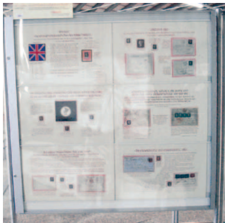
Eksperimentiranje z velikostjo listov. 3 x 3 listi, za pole so pa kar primerni, 2 x 3 listi, delujejo kar nekam prazno.

Pohvalo je dobil tudi eksponat Slovenija, ki ga je za predstavitev posameznih članic AJF v netekmovalem delu razstave pripravil Bojan Bračič.