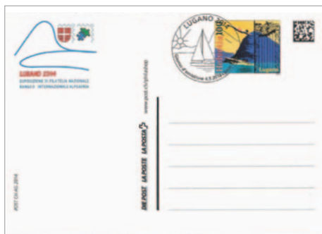
Švicarska pošta je malo pred razstavo (4. septembra) izdala razglednično dopisnico kot ponatis stare razglednice Lugana in znamko posvečeno Luganu.