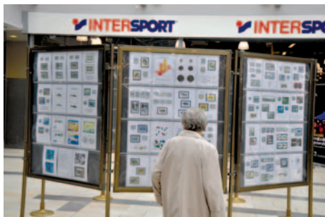
Razstava v Mercator centru v Celju.

V Celje se je po potovanju po Sloveniji, »vrnila« filatelistična zbirka rib. Prvič je bila razstavljena ob prazniku slovenskih ribičev, junija letos v prostorih Državnega sveta. Potem so jo prenesli v BTC, pa v Mursko Soboto, pa ... .. Zdaj