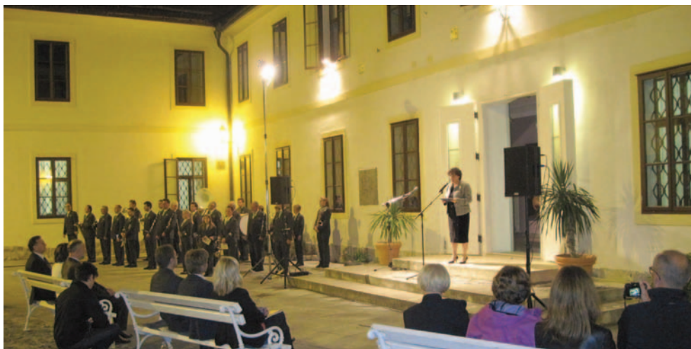
Ministrica za kulturo odpira razstavo.

ob ogledu razstave Loškega muzeja, do 1. februarja 2015.