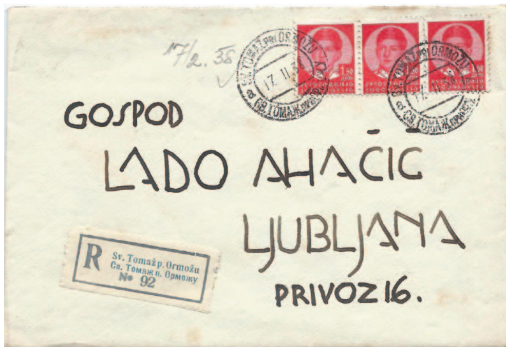
Priporočeno pismo prve masne stopnje je po ceniku iz leta 1931 pravilno frankirano. Pismo 1,50 din + priporočnina 3,00 din.