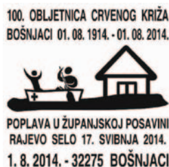
Hrvaški priložnostni žig na temo poplav.

Verjamemo lahko, da bodo izredne poplave v letu 2014, kot jih ne pomnimo na območju Slovenije, vzhodne Hrvaške, Bosne in Hercegovine ter Srbije oziroma porečja reke Save spodbudile komisije, ki odločajo o motivih na znamkah, in izdajatelje znamk o trajnem zaznamovanju teh dogodkov. S tem bi pomagali nesrečnim prebivalcem poplavljenih območij, toda tudi poučno delovali na širše mase ljudi, katerih glas je zelo pomemben, ko je vprašanje dolgoročne strategije obrambe pri naravnih nesrečah, kot so poplave.