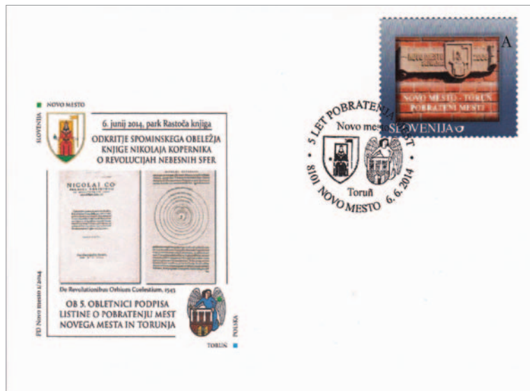
Spominski ovitek ob postavitvi spomenika Kopernikovi knjigi O revolucijah nebesnih teles v Parku rastoče knjige.

Naše društvo najdete tudi na spletu, saj imamo že več kakor 10 let svojo spletno stran. Ni vedno popolnoma ažurna, a se trudimo. Nanjo najlažje pridete tako, da obiščete spletno stran FZS