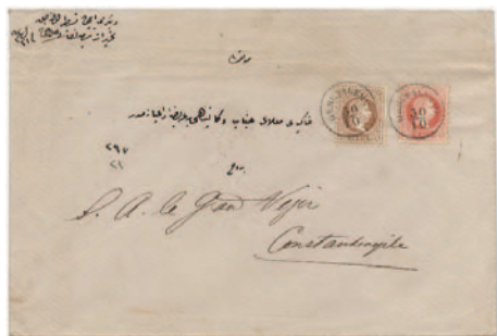
30. oktober 1876 - pismo z dvojno težo, poslano iz Jeruzalema v Konstantinopol. Zadaj dohodni žig Lloyd Agencije 15.11. v Konstantinoplu. Poštšina 20 soldov za dvojno težo.

natančni, hitri in zanesljivi dostavi pošte. Zato so konkurirali majhnemu francoskemu poštnemu uradu in tudi novo nastali otomanski poštni uradi (1870) niso bili tako uspešni.