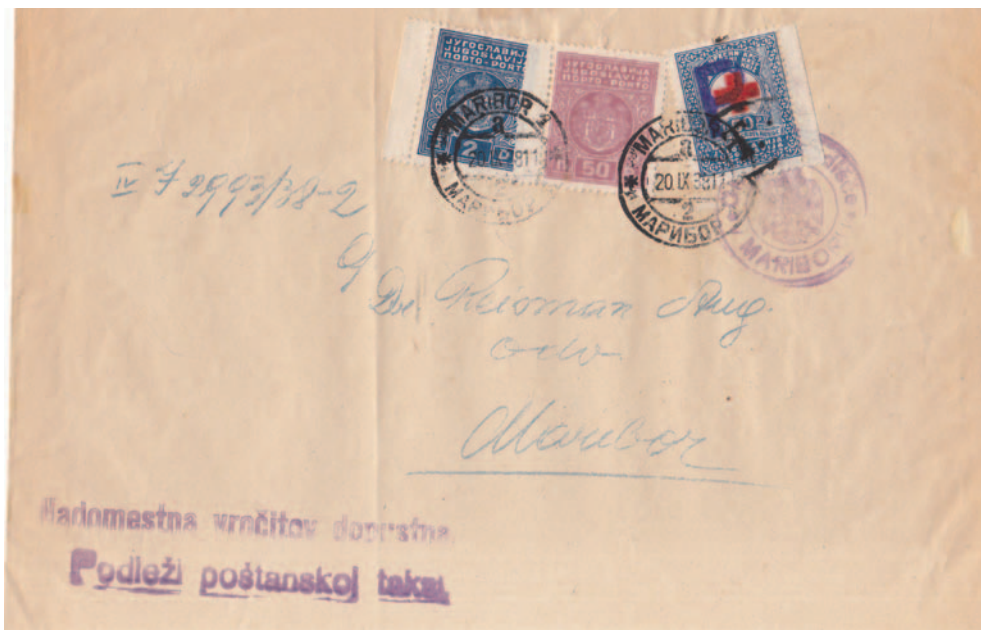
V tem primeru je znamka poleg žiga P žigosana tudi s črnim žigom T.