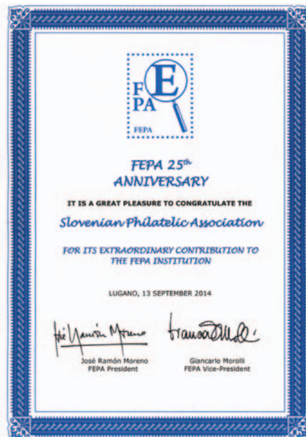
Priznanje FEPA Filatelistični zvezi Slovenije.