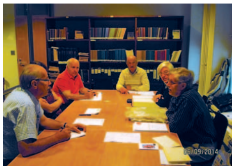
Na skupščini Euro-Phile. Predstavniki (od leve) Švedske, Belgije, Slovenije, Nizozemske in Finske.