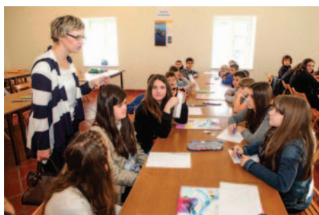
Utrinek s praktičnega dela filatelistične šole.

V okviru IX. filatelistične šole v Trakošćanu smo poleg krožkarjev iz Hajdine sodelovali tudi drugi. Dan prej so tam odprli mednarodno mladinsko filatelistično razstavo, na kateri so po-