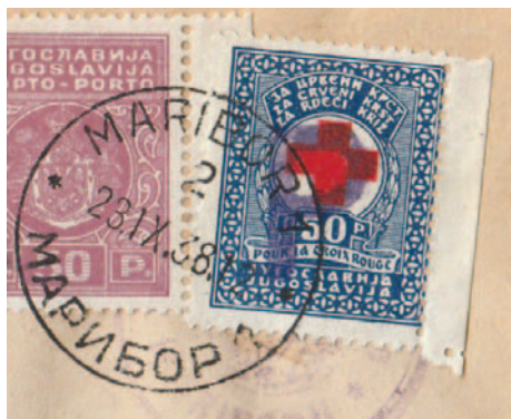
Mariborski porto-provizorij na službenem pismu iz Ptuja v Maribor.

Izgleda, da je pošta Maribor 1 ostala brez porto znamk in je franko-doplačilne znamke modre barve žigosala z modrim žigom P, kot je videti na sliki 8. Videl sem še nekaj drugih primerov z datumi od 20. do 23. septembra 1937; vsi so na službenih pismih.