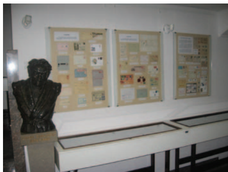
Razstava o filateliji, kraljici hobijev.

Letos smo predddverje knjižnice zasedli kar za tri mesece in zaporedoma postavili tri razstave. V juniju smo, ob 5. obletnici podpisa sporazuma o pobratenju Novega mesta s poljskim Torunjem, prikazali odtise poštne žigov torunjskih pošt, v juliju pa filatelistični material o prvi človekovi stopinji na Luni, pred 45. leti. Avgusta smo se spomnili 10. obletnice vstopa Slovenije v EU in obiskovalcem knjižnice predstavili filatelistični material na temo združene Evrope. Julija je bila, ob dnevu slovenske policije, v prostorih Policijske uprave Novo