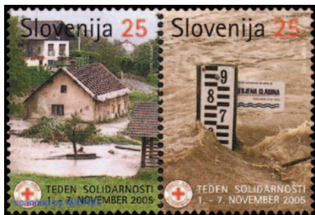
Slovenska doplačilnica za pomoč žrtvam poplav iz leta 2005.

Najzgodnejša znana, toda zagotovo največja poplava na Zemlji, je bil po Bibliji svetovni potop kot posledica 40-dnevnega neprekinjenega dežja. V Mezopotamiji, zibelki današnje civilizacije, je prihajalo do poplav zaradi rek Eufkrat in Tigris. Tega niso mogli preprečiti niti največji vladarji tistih časov. Tudi v novejši zgodovini so znane velike katastrofe zaradi poplav z milijoni mrtvih in neprecenljivo materialno škodo. Reke Huang He (Rumena reka), Yangtze in Huai so v zadnjih 150 letih odnesle več milijonov ljudskih žrtev. Tudi evropske reke kot Donava, Ren, Sava, Volga, Sena in druge so se izlivala iz svojih korit in pri tem povzročile velike gospodarske škode in odnašale človeška življenja.