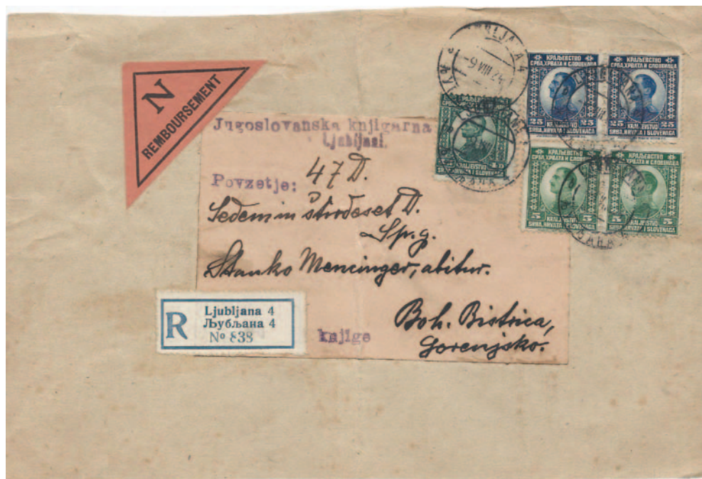
Del ovoja tiskovine (knjige) z odkupnino. Po ceniku iz leta 1922 je poštnina za tiskovino z maso 450 g 1,80 din (9 x 0,20), priporočnina 2,00 din, odkupnina 0,50 din in obvestilo o pošiljki 0,30 din. Skupaj 4,60 din.

Prekmurje uradno priključeno Kraljevini SHS šel s Trianonsko pogodbo 4. junija 1920, čeprav so ga čete SHS zasedle že leto prej. S cenikom, ki je začel veljati 16. maja 1920, začenjam to obdobje ob dejstvu, da so 24. junija 1920 izšli Verigarji z nazivnimi vrednostmi v dinarjih, čeprav so se znamke v vinarjih in kronah še naprej uporabljale. Vse prikazane cene v preglednici so v dinarjih. Izmed vseh storitev sem poskusil izbrati tiste, ki so za zbiralce najbolj zanimive, saj bi objava celotnih cenikov zahtevala bistveno več prostora, razen tega so se nekatere storitve plačevale v gotovini, kar je za večino zbiralcev manj zanimivo.