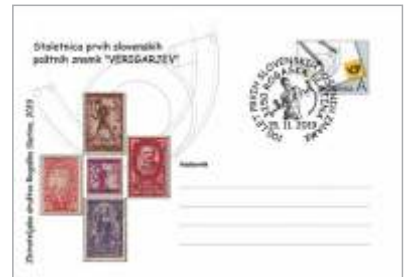
Društvo je pripravilo tudi priložnostno izdajo