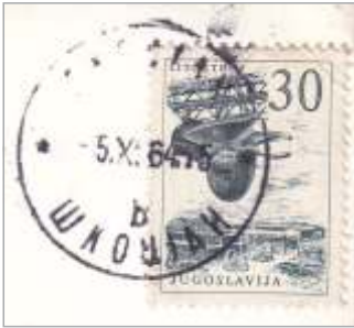
Odtis žiga obračunske pošte Škocjan z oznako b iz novembra 1964 (BP).

morali napisati pošto Škocjan in ne Bučke, kot nekoč.