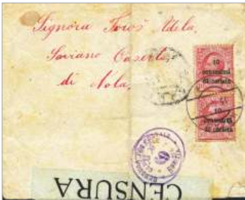
Slika 28 * Kozana v Brdih 15. 4. 1919 – Pismo v Nolo.

Dvojezični avstrijski žig tipa Guller, izvedba a. Odtis poštne cenzurne štampljke št. 4 v Trstu. Naslovnik kasneje zradiran.