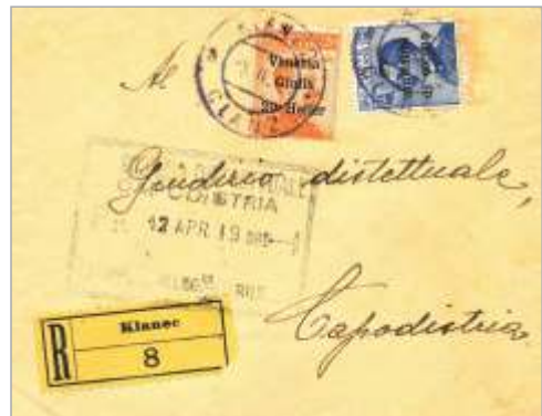
Slika 26 * Klanec 9. 4. 1919 – Priporočeno pismo v Koper.

Frankirano z znamkami tretje izdaje. Plačana poština 1,23 K, 20 vinarjev za pismo, 25 vinarjev za priporočnino in 60 vinarjev za nujno dostavo (uporabljeni dve Express znamki po 30 vin) ter 15 (3 vinarje preveč) ali 20 vinarjev (dva vinarja premalo) za četrto ali peto težnostno stopnjo. Italijanski žig GORIZIA CENTRO tipa Guller, izvedba 2A. Avstrijska priporočilna nalepka Görz 1 je pretisnjena z vijoličasto štampiljko »Gorzia Centro«. Cenzurni trak in (na hrbtni strani) odtis v črni barvi dvokrožnega cenzurne štampiljke N. 63 (v sredini) z napisom (med krožnicama) »COMMISSIONE DI CENSURA / presso l'ufficio postale«.