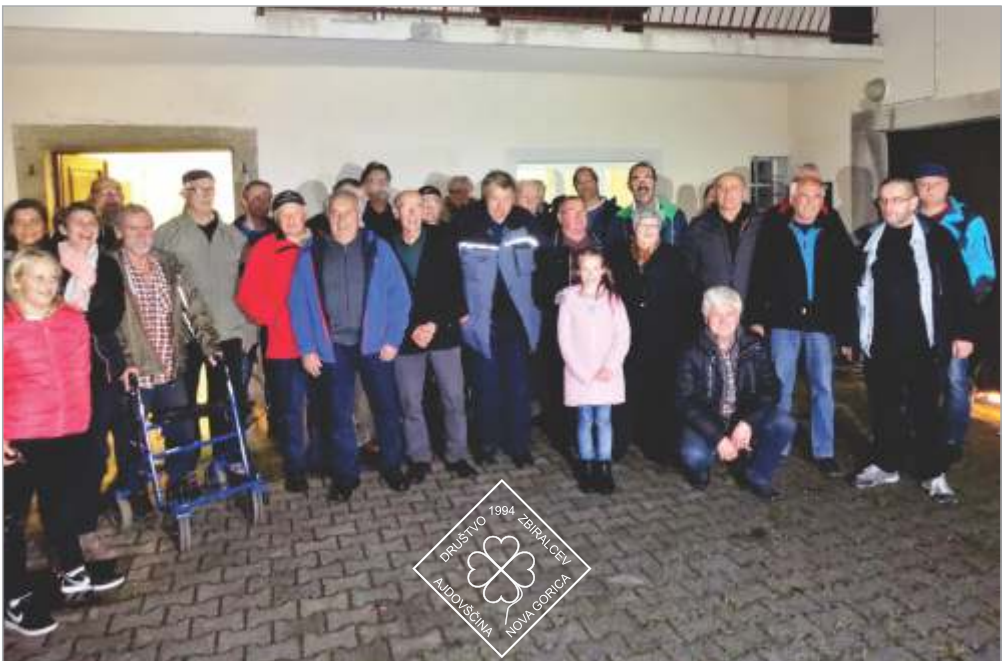
Prvo srečanje v novih društvenih prostorih 15. 11. 2019.