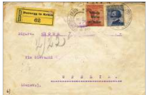
Slika 22 * Trnovo pri Ilirski Bistrici 8. 3. 1919 – Priporočeno pismo v La Spezio.