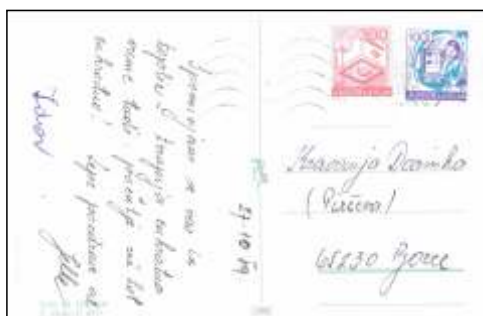
Na sliki 5 je kartica, poslana 30. 10. 1989 iz

Podčetrtka v Bovec in pravilno frankirana z znamkama za 300 in 1000 dinarjev. Za pismo je bilo potrebno plačati 1600 dinarjev, za tujino pa 15000 dinarjev.