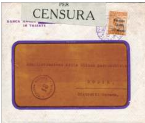
Slika 24 * Trst 15. 3. 1919 – Pismo v Rodik.

Plačana poština 50 vinarjev: 25 vinarjev za pismo do 15 g za tujino (!) in 25 vinarjev za priporočnino (italijanska tarifa od 1. 10. 1907). Dvojezični avstrijski žig tipa Guller, izvedba a. Odtis okrogle pošne cenzurne štampiljke št. 4 v Trstu v vijoličasti barvi.