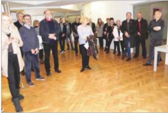
Odprtje razstave v Rogaški Slatini

Ob stoletnici prvih slovenskih poštnih znamk Verigarjev je manjšo razstavo v Mestni galeriji Rogaška Slatina pripravilo Društvo zbiralcev Rogaška Slatina.