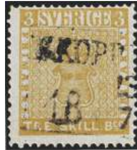
Rumena znamka za 3 skillinge

Rumena znamka za 3 skillinge (švedsko: Gul tre skilling banco ) je švedska znamka, od katere obstaja le en sam primerek. Znamka je bila žigosana v kraju Nya Kopparberget (danes poznan kot Kopparberg, približno 150 km oddaljenem od Uppsale).