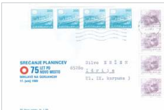
Na sliki 4 je pismo pravilno frankirano s 4 x 200 din in 4 x 100 din, skupaj 1200 dinarjev. Poslano iz Novega mesta 23. 9. 1989 v Idrijo. Če podrobneje pogledamo, vidimo, da je datum »obrtnjen na glavo«. Poština za kartico ali dopisnico je bila 1000 dinarjev, za tujino 6000 dinarjev. Tarifa je veljala od 21. 8. 1989 do 5. 10. 1989.