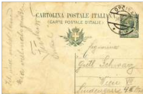
Slika 34 * Opčine 26. 12. 1919 – Dopisnica na Dunaj.

Cenzure poštних pošiljk je bilo v glavnem konec z letom 1919.