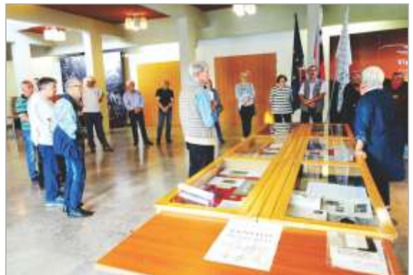
Razstava v Ajdovščini.

Ajdovščini. Leta 1970 je diplomiral iz geologije in ena izmed njegovih vseživljenjskih ljubezni so bili meteoriti, poleg njegovega interesa za lokalno zgodovino, filatelijo, numizmatiko, biologijo, glasbo in še mnogo drugega. V Ajdovščini nameravamo pripraviti še kakšno tematsko razstavo o njegovem delu.