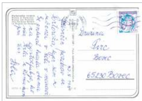
Slika 3 prikazuje razglednico, poslano iz Portoroža 30. 8. 1989 v Bovec in plačano poštino 1000 dinarjev. Za pismo je bilo potrebno plačati 1200 dinarjev, za tujino pa 6000 dinarjev. Tarifa je veljala od 21. 8. 1989 do 5. 10. 1989.