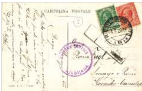
Slika 35 * Trst 5. 3. 1920 – Razglednica na Koroško.

Italijanska dvojezična (italijansko francoska) dopisnica za 15c za notranji (!) promet (tarifa v veljavi od 1. 3. 1919), izdana 24. 9. 1919 in letnico (19) pod grbom. Avstroogrski žig, izvedba b.