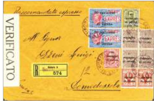
Slika 25 * Gorica 29. 3. 1919

Pravilna tarifa za 20 vinarjev, plačana z ustrežno znamko četrte izdaje. Italijanski novi žig TRIESTE P.zza DELLA BORSA tipa Guller, izvedba 3C. Odtis okrogle pošne cenzurne štampiljke št. 18 v Trstu v vijoličasti barvi in cenzurni trak.