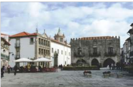
Osrednji trg mesta Viana do Castelo

Naše zbirke so dosegle zelo dobre rezultate. V povprečju smo dosegli dobrih 85 točk, kar odgovarja zlati medalji na razstavi prvega ranga. Čestitke vsem razstavljavcem!