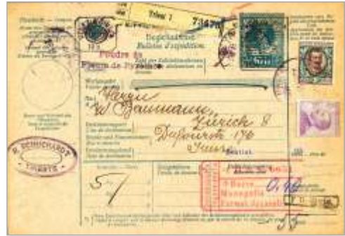
Slika 32 * Trst 25. 10. 1919

Vsaj do konca maja 1919 so uporabljali avstrijske formularje. Nato so pripravili tudi formularje za telegrame, potrdila za pošiljke telegramov, poštne spremnice za pakete in poštne nakaznice. Pretiskali so jih z gumijastimi štampljkami, ki so imele napis Venezia Giulia .