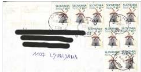
Ljubljana: 10 \times 16 \text{ SIT} + 61 \text{ SIT} = 221 \text{ SIT}

Na vseh treh pismih je uporabljena enaka formula: 10 \times A + X = 221 . A je vrednost desetih znamk, 221 SIT je cena za pismo do 20 g, X pa je vrednost je vrednost na strojni nalepki, ki jo je moral poštni uslužbenec izračunati. Na žalost so strojne nalepke natisnjene na termo papirju, ki ni obstojen na sončni svetlobi in pri višjih temperaturah, zato je napis na nalepkah že skoraj neviden.