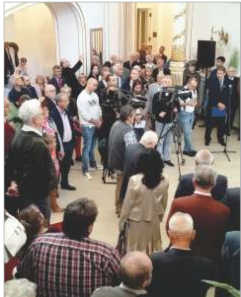
Na odprtju se je zbralo veliko obiskovalcev