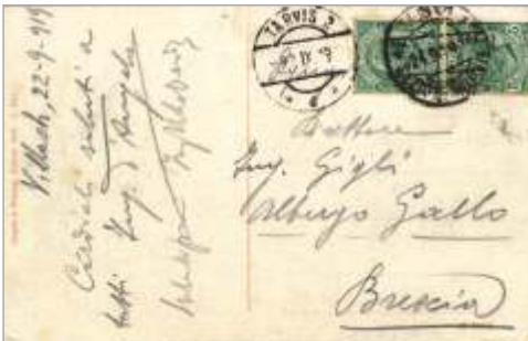
Slika 31 * Trbiž 22. 9. 1919 – Razglednica v Brescia.

Mirovna pogodba, podpisana med Italijo in Avstrijo v Sait Germainu 10. septembra 1919, je določila meje na južnem Tirolskem in v Kanalski dolini, ne pa vzhodne meje z novonastalo Državo SHS.