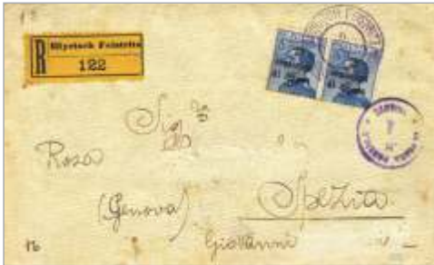
Slika 23 * Ilirska Bistrica 9. 3. 1919 – Priporočeno pismo v La Spezio.

Na hrbtni strani odtis ovalne pošne cenzure štampiljke (nečitljiv kraj) v vijoličasti barvi na cenzurnem traku.