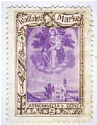
Kostanjeviška romarska znamka

Gorici in ob tej priložnosti smo v društvu izdali razglednico in pripravili priložnostni poštni žig, Frančiškanski samostan Kostanjevica pa je izdal osebno znamko.