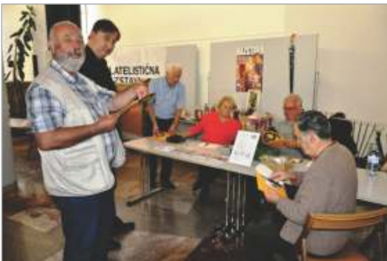
Brez ekipe zvestih sodelavcev se takih razstav seveda ne da izpeljati.

Razstava v Trbovljah ostaja vse od začetka zvesta svoji ideji. Ta pa je, da so vrata odprta vsem razstavljavcem, ki bi radi prvič pokazali svoj eksponat* na ocenjevalni razstavi, kjer bi lahko dobili napotke, kako s tem eksponatom nadaljevati, ga nadgrajevati iz izboljšati, da bo zasijal tudi na svetovnih razstavah. Škoda je, da takšne priložnosti, ki se nam ponuja vsaki dve leti, filatelisti ne znamo dovolj dobro izkoristiti.