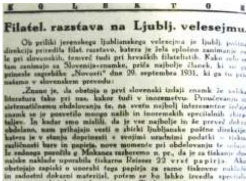
Del članka iz revije Kolektor 1931

Kot smo izvedeli, namerava en domači specialni zbiratelj Slovenije objaviti svoja raziskovanja o raznih tiskovnih napakah. Teh je tudi zelo veliko, kot je raznih papirjev in raznih barv. Upamo, da nam bo uspelo to delo kmalu obelodaniti.