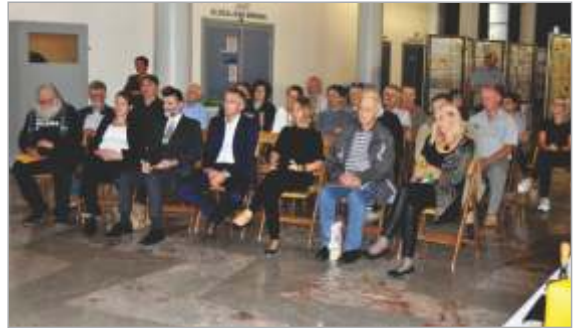
Med odprtjem razstave

S strani FZS sem bil določen za svetovalca na tej razstavi. Moram priznati, da nisem imel težkega dela, saj imajo tamkajšnji organizatorji dovolj izkušenj za pripravo takih razstav. Je pa res, da v revirje rad prihajam, saj sem nekaj metrov stran od razstavišča preživel marsikako lepo urico pri babici, dedku in sorodnikih, pa tudi sicer sem že