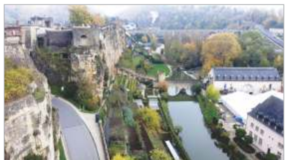
Luksemburg je slikovito, nekdanje dobro utrjeno mesto nad kanjonom reke Alzette.

Prvi dan, ko so sodniki že ocenjevali literaturo, so potekala ločena zasednja poštних uprav in filatelističnih zvez, s skupnim sestankom na koncu. Obravnavali smo poenotena pravila za pripravo razstav, plan razstav v bodoče (naslednjo razstavo Multilaterale bo pripravila Avstrija poleti 2021 v St. Pöltnu, leta 2023 pa je na vrsti Slovenija, za nami pa Lihtenštajn 2025), predvsem pa različne aktivnosti tako zvez kot tudi pošt za delo z mladimi in splošno promocijo filatelije. Ker so sestanki ML tudi v letih, ko ni razstav, je bil dogovorjen naslednji sestanek oktobra 2020 v Sindelfingnu. Veliko pozornosti je bilo namenjene delu z mladino in sploh pridobivanju članstva. V obravnavi je bila tudi postavitev spletne strani Multilaterale.