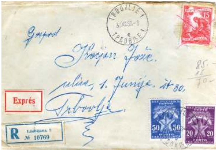
Pismo »poštino plača naslovnik«

ko je tudi plačal porto poštino 70 din. Vestna poštna uslužbenka je ob strani zapisala račun: 85 - 15 = 70 ! Znesek 50 je bil za priporočeno pismo, dodatnih 35 pa še za »nujno«. To je meni prvi doslej poznan primer tako poslanega pisma: poštino plača naslovnik . Ta storitev v Sloveniji (sodeč po ceniku) ni mogoča, velja pa za pakete!