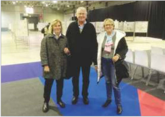
Komisar z dvema pomočnicama, ki sta sodelovali pri vstavljanju slovenskih eksponatov v razstavne vitrine.

Luksemburžani so zelo solidno pripravili in izpeljali regionano razstavo iz serije Multilaterale. Iz nekoliko oddaljenega hotela so organizirali dnevne prevoze v eno in drugo smer. Prehrana je bila organizirana na sejmišču oziroma v hotelu.