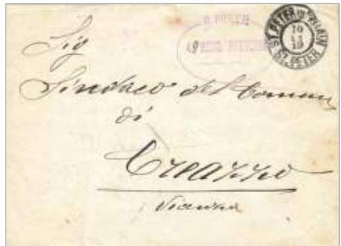
Slika 33 * Pivka 10. 11. 1919

Službena vojaška pošta je bila prosta poštne. Glej primerek pisma iz Pivke.