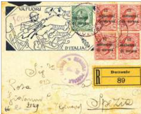
Slika 27 * Dutovlje 10. (?) 4. 1919 – Priporočeno pismo v La Spezio.

Ovojnica z italijansko vojaško propagando. Frankirano z znamkami tretje izdaje. Plačana poštnina 45 vinarjev, tarifa 20 vinarjev za pismo in 25 vinarjev za priporočnino.