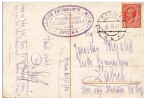
Slika 36 * Opčine 22. 11. 1920 – Dopisnica na Češko

12. novembra 1920 je bila z Rapalsko pogodbo tudi meja med Kraljevinama Italijo in Jugoslavijo določena in z njo izgubljena celotna Primorska.