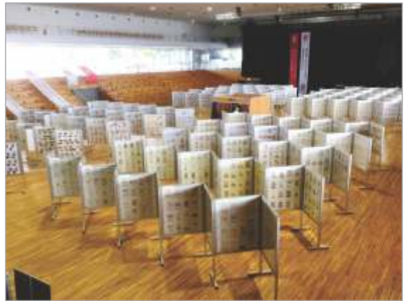
Pogled na razstavne vitrine v novi športni dvorani

Portugalci so celotno razstavo zelo dobro pripravili. Odvijala se je v novi športni dvorani ob reki Limi, zgrajeni s pomočjo Evropske unije. Dvorana se nahaja pod