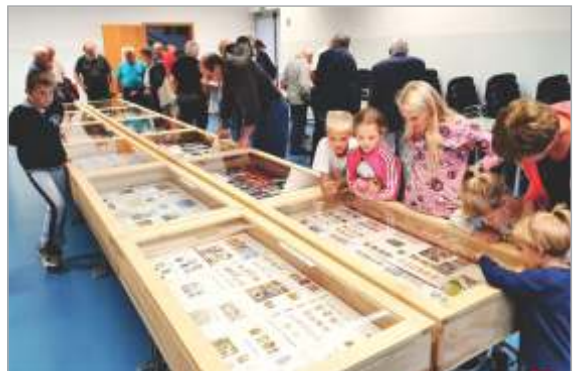
Tudi mladi so si z zanimanjem ogledovali zbirke.