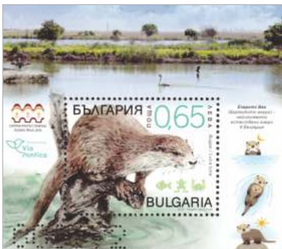
Blok z vidro

Nakup teh znamk je izgledal tako, kot pri nas obisk nekaterih zdravnikov ali laboratorija. Interesenti za nakup so najprej dobili zaporedne številke. Ko je bila znamka uradno dana v promet, so klicali te številke, s katerimi je njihov lastnik dobil možnost nakupa znamk. Je bilo kar »živahno« ob prerivanju za številke in en dan so se za to skoraj stopli, kot smo izvedeli kasneje – ta dan smo imeli gostje iz tujine organiziran ogled starega dela Plovdiva in nas takrat ni bilo na razstavišču. Do »hude krvi« je prišlo tretji dan razstave, ko je uradno izšla znamka v bloku z motivom vidre.