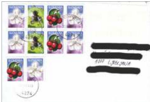
Žirovnica: 10 \times 5 \text{ SIT} + 171 \text{ SIT} = 221 \text{ SIT}

Pisma so dokaz, da uporabljamo desetiški številčni sistem z osnovo 10. Zato znamo z 10 tudi najbolje računati. Poštni uslužbenci so vedno uporabili 10 znamk iste vrednosti in natisnili nalepko z razliko do potrebne poštnine. Vedno bi lahko uporabili več istih znamk ali znamke z drugo vrednostjo, vendar bi to zapletlo izračun. Verjetnost napake bi se močno povečala.