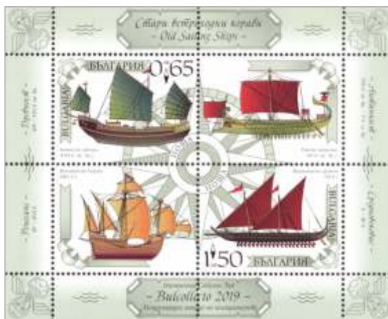
Znamke, posvečene sejmu Bulcollecta

filatelistično zvezi po 14,00 levov za komplet obeh variant. Denar bo šel za razvoj mladinskih in razstavnih dejavnosti zveze. Poleg tega je bilo izdanih 600 izvodov neperforiranih blokov s prečrtano nazivno vrednostjo, kot spominska izdaja (taka je uradna deklaracija); natisnjene so na papirju za etikete, karkoli že to pomeni, in oštevilčene.