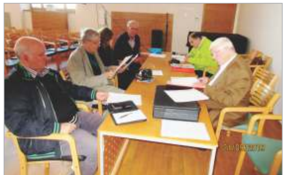
Delovno srečanje klubov združenja EUROFILA