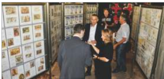
Po odprtju razstave so si obiskovalci z zanimanjem ogledovali razstavljene eksponate.

Organizatorji so za obiskovalce pripravili tudi različne društvene izdaje. Poleg treh osebnih znamk je bil vsak dan posebej na voljo tudi priložnostni poštni žig. Zadnji je v soboto pozdravljal prihajajočo novo razstavo FIRAMLA, ki bo od 16. do 19. aprila 2020 prav tako v Trbovljah, kamor že sedaj vabimo vse mladinske krožke in posameznike, ki bi želeli razstavljati na tej razstavi.