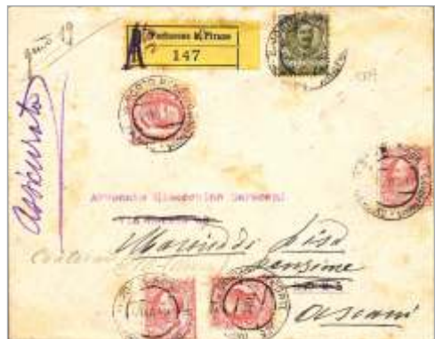
Slika 30 * Portorož 21. 7. 1919 – Vrednostno pismo v Rim, preposlano v Marino di Pisa.

Poštnina 30 vinarjev, 20 vinarjev za pismo in 2x5 vinarjev za pismo tretje težnostne stopnje, plačana s tremi znamkami za 10 vinarjev druge izdaje. Avstrijski dvojezični žig tipa Guller, izvedba ni razvidna. Odtis okrogle poštne cenzurne štampljke št. 48 v Trstu v črni barvi ter cenzurni trak. Ker so od 20. aprila stopile v veljavo italijanske znamke v lirah, so postale pretiskane znamke neveljavne in so prejemniku pismo zaračunali z dvojno poštnino, dve italijanski porto znamki za 30c.