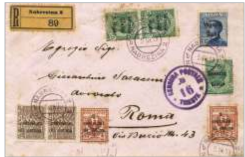
Slika 21 * Nabrežina 5. 3. 1919 – Priporočeno pismo v Rim.

Nato so 20. februarja 1919 pretiskali italijanske znamke s trivrstičnim pretiskom »Venezia / Giulia / 5 Heller« in »Venezia / Giulia / 20 Heller«, čemur so Italijani na zasedenih ozemljih ostro nasprotovali.