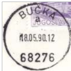
Odtis žiga PP Bučka z oznako a in poštno številko 68276 iz leta 1990 (BK).

Pomožne pošte so imele običajno le po en žig z oznako a pod krajevnim imenom, vsi žigi pa so imeli v sredini datumsko vrstico z nastavljenima datumom in uro odprave pošiljk. Dokler PP Bučka ni dobila novega žiga s poštno številko 68276, je uporabljala starega. Žigi brez poštних številok so bili vzeti iz prometa šele 1. novembra 1972 (28).