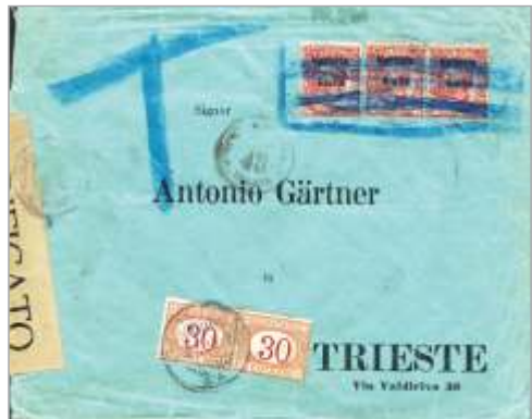
Slika 29 * Brtonigla 6. (?) 5. 1919 – Pismo v Trst.

20. aprila 1919, ko so z menjavo valute od avstrijskih kron v italijanske lire stopile v veljavo italijanske znamke in tarife. In to kljub temu, da bi morale po mednarodnem pravu ostati tarife in promet avstrijski do mirovne pogodbe.