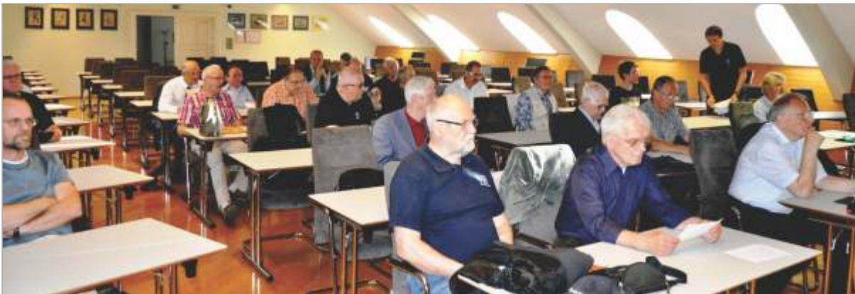
Zbor članov FZS leta 2018

Za zbiranje in urejanje kandidatur imenuje IO FZS tričlansko komisijo, ki evidentira kandidate in pridobi njihova soglasja za opravljanje predlaganih funkcij. Komisija mora biti ustanovljena najmanj tri mesece pred sejo zbora članov, na kateri so opravljene volitve. Čas hitro teče, zato razmislite o možnih kandidatih za funkcije v organih FZS; predvsem o takih, za katere veste, da