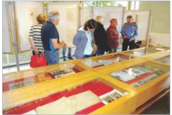
Na razstavi v Ajdovščini si je bilo moč ogledati obilico zanimivega gradiva.