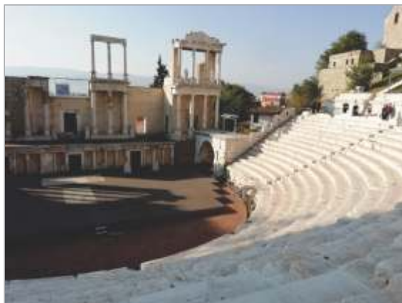
Rimsko gledališče v starem Plovdivu

Naklada bloka z vidro je samo 3600 kosov. Od tega je bilo 1800 natisnjenih na negumiranem papirju z UV-nitkami in s perforacijo ter oštevilčenimi od 0001 do 1800. Druga polovica je bila natisnjena na gumiranem papirju in oštevilčena od 1801 do 3600. Izdajo bo moč dobiti pri bolgarski